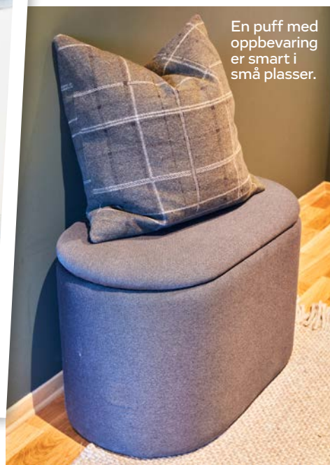
En puff med oppbevaring er smart i små plasser.