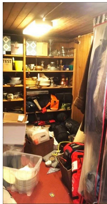
FORTID: Sånn var det...