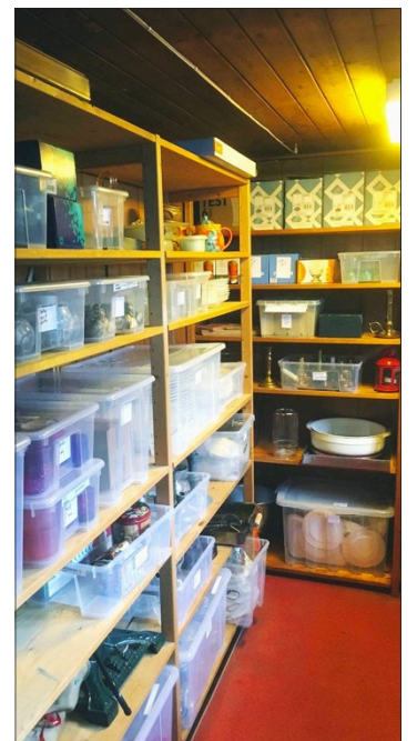
NÅTID: ...og sånn er det nå.