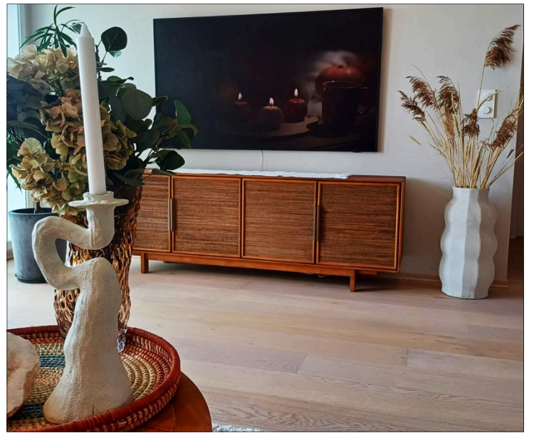
ORDEN: Bedriften til Anne Brit hjelper folk å skape orden der det er uorden.